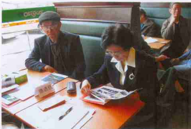
校友在《他们从这里走向世界》一书看到了老同学