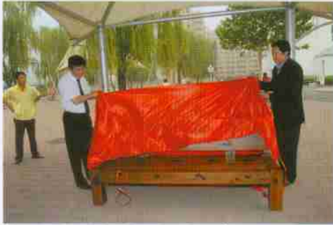
施校长为校友捐赠古沉船甲板长椅揭幕