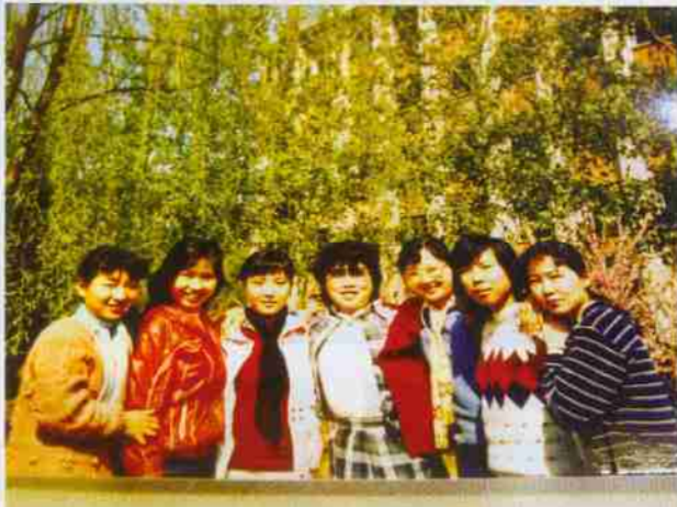
老照片：88届俄语班女生在主教学楼前合影