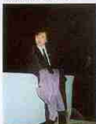
校园摄影比赛（2009年二月） 来（2008年秋） 校园摄影比赛（2009年二月）