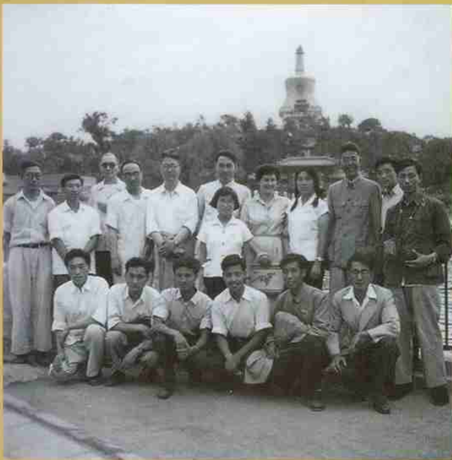
第一届意大利语师生与学院领导在北海公园合影 摄于1957年

1956年，我校前身——北京对外贸易学院招收了首届意大利语班本科生，共9人，他们也是中国历史上招收的第一届意大利语专业本科生。