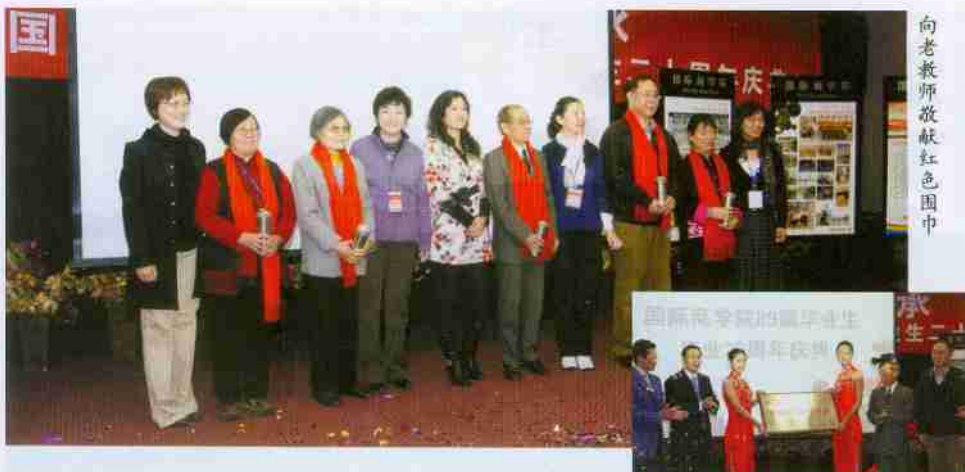
向老教师敬献红色围巾