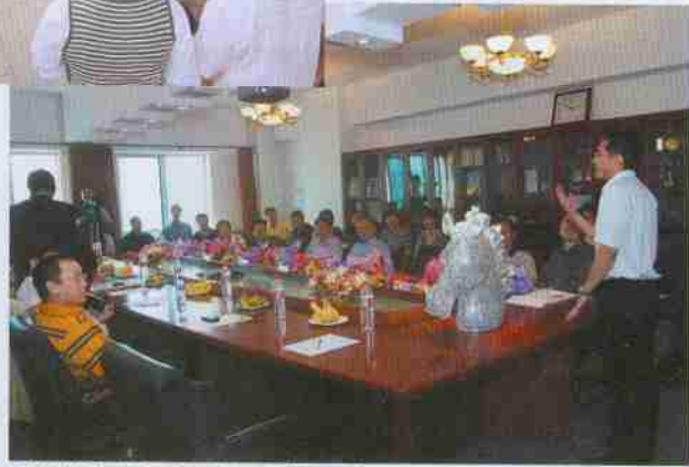
国际经济贸易学院为校友举行了隆重的欢迎仪式