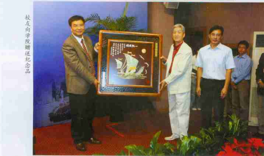
校友向学院赠送纪念品