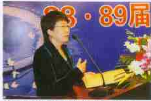
校友介绍爱心基金成立情况