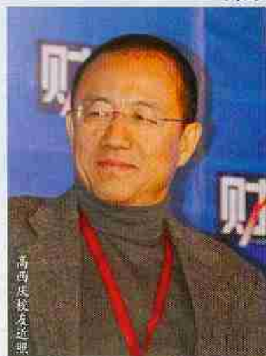
高西庆校友在送别

我曾于 1999 年、2001 年、2006 年三次采访高西庆老师，前后跨越了二十一年，而且每次相隔约十年。第一次，他刚从美国回到北京，一边在母校教法律，一边着手建立中国证券市场；第二次是他离任中国证监会任首席法律顾问一职，即将赴香港任中银基金管理公司副任筹建中银国际；第三次是最近在他中投公司的办公室，之前的十一早已完成了中国证监会副主席和中国证券基金理事会副理事长两个重要任职。高西庆的个人历程，是中国改革开放和市场经济历史的重要篇章。面对这一赫然大名，大记者之雄姿英发，然而，「宽袖之襟，游刃有余乎」？写此诗，是有感而发。