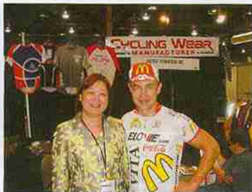
与自行车比赛世界冠军合影