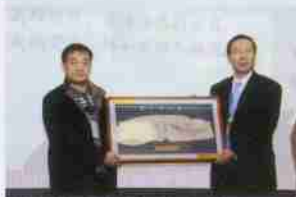
校友向母校赠送纪念品