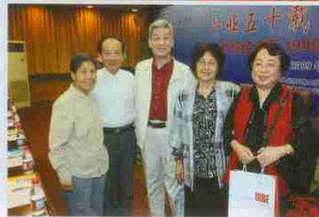
部分校友合影留念