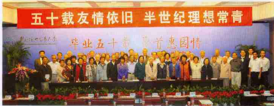
全体校友与领导、教师合影留念