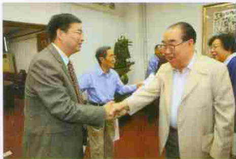
经贸学院赵忠秀院长欢迎校友、原新华社香港分社副社长乌兰木伦