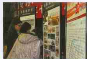
在老照片展板前驻足