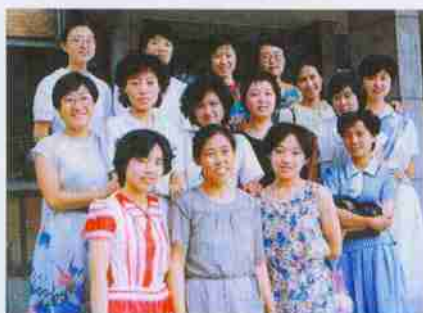
国际经济合作系（六系）89届老照片： 二十五年前的老师和同学

老师和我们 勤奋， 认真， 是精英， 是脊梁！ 请母校放心， 奋斗的岁月， 我们还将一如既往！