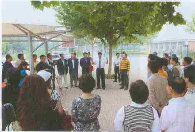
施校长接见校友并发表讲话