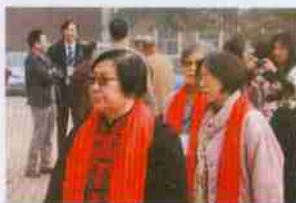
参加活动的老教师