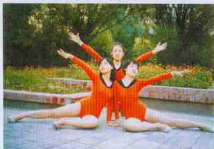
国际经济合作系（六系）89届老照片： 1987年，贺女艺术节我们班的美女们

每个人都有很多故事要讲 既然聚在一起， 大家敞开心扉， 将不快的过去抛掉， 把欢欣的未来迎接， 希望大家都 幸福安康！