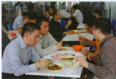
校友们到学生食堂吃“忆苦饭”