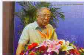
校友代表、原外交部副部长杨福昌发言