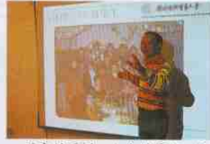
历史的瞬间，人生的跨越：校友回顾当年在校学习生活情况