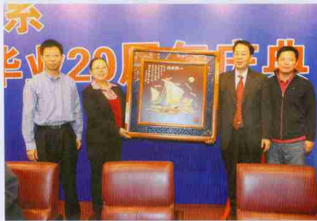
校友向学院赠送纪念品