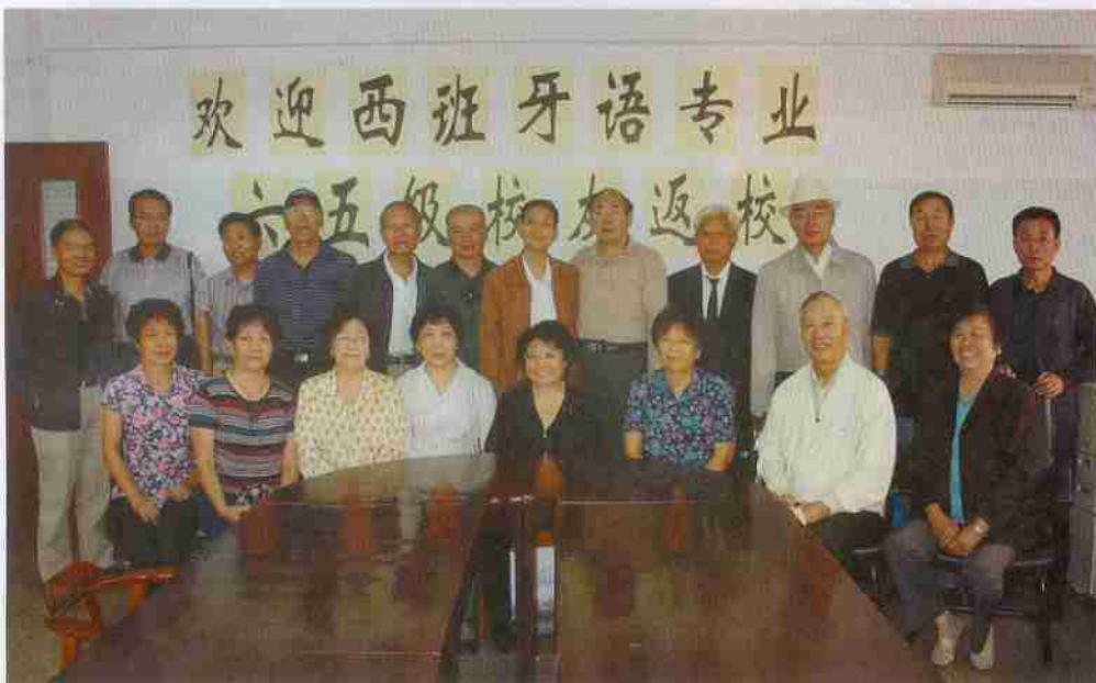
校友与外语学院、总会领导合影留念