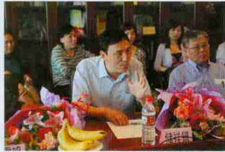
当年的老师、现北京市贸促会副会长傅祥银