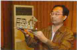
校友展示赠送教师的“犒子牛”水晶笔筒