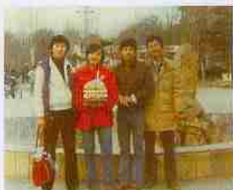
1985年12月3日与校广播站的同学庆祝生日