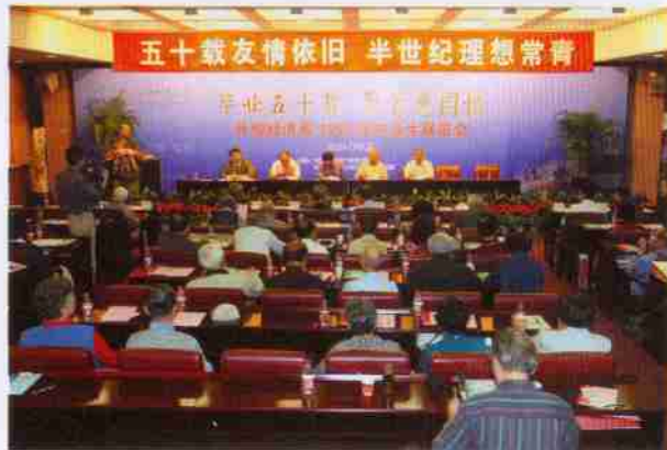
1959 届外贸经济系校友隆重纪念毕业 50 周年联谊会