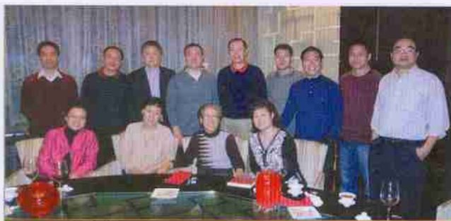
国际经济合作系（六系）89届毕业二十年聚会合影：

离开这里20年了， 我们 国际经济合作系89级 来向您汇报： 感谢经贸大学的培养！ 现在的我们