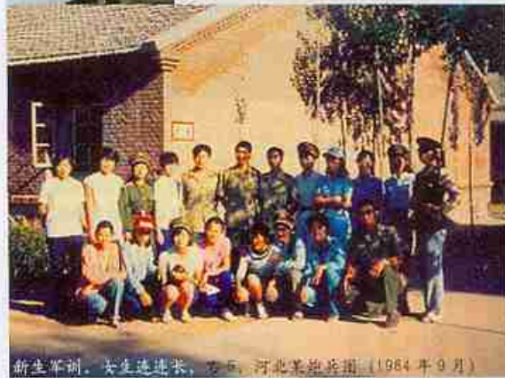
新生军训，女生连连长，右5，河北美院兵团（1984年9月）