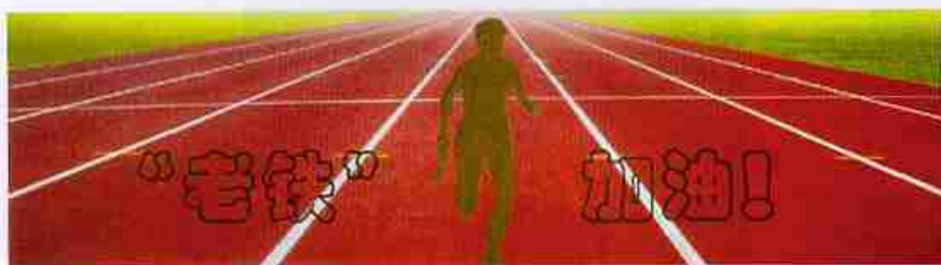
——访 85 届校友、加拿大 Vastrade International 公司总经理 张晴