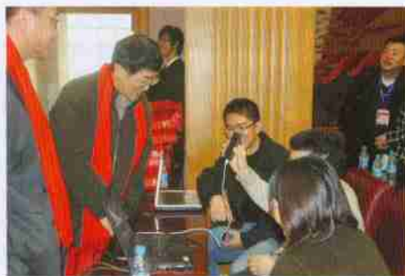
当年的辅导员和在海外的校友视频通话

会上，校友们还特意为参会的领导和教师献上了精心准备的红色羊绒围巾和定制的保温杯表达慰问，暖意浓浓，师生情长！随后全体师生在诚信楼前合影留念，冬日暖阳映照在他们略显沧桑的脸上，那一道道纹路是岁月的轨迹，更是成功的见证！