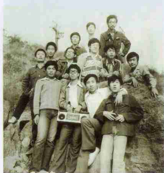
老照片：89 届阿语班（1989 年摄于长城）