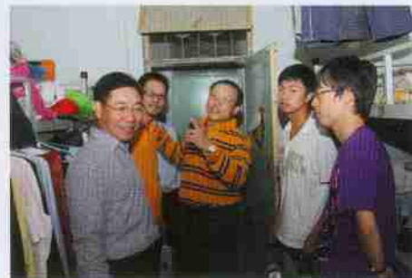
校友兴致勃勃地重游当年宿舍