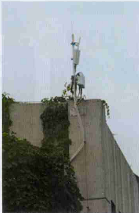
校友捐赠的校园无线 AP 系统设备