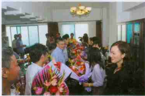
“校花”们为领导和老师献花