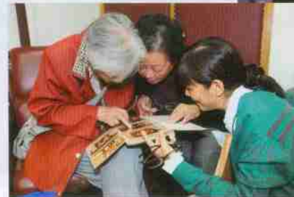
左图：校友与教师 分享老照片