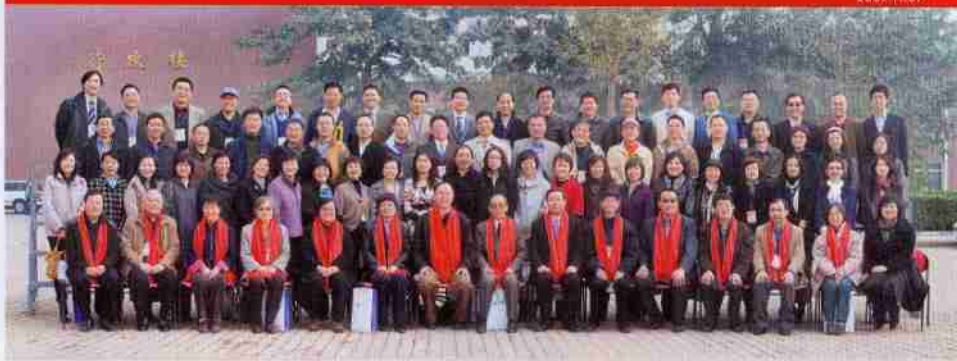
对外经济贸易大学国际商学院 1989 届校友返校庆典活动合影留念