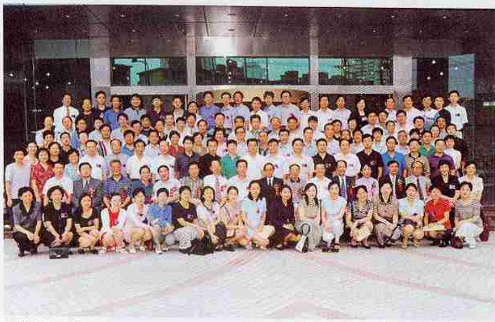
江苏省校友分会于1999年9月在南京成立。图为出席成立大会的校友与校领导合影