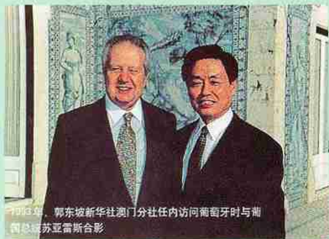
1995年，郭东坡新华社澳门分社任内访问葡萄牙时与葡国总理苏亚雷斯合影

随着逐渐进入角色，他发现侨务工作其实很大程度上也是涉外工作。由于他过去多年从事外贸，加上在澳门新华分社的经历，他一到侨办，就发现和海外华侨、华人的共同语言非常多。他说：“过去的朋友中很多人既是华侨社团组织的负责人，又是商界领袖。过去我工作中接触的那些朋友，同样也是一见如故的感觉。不论是贸促会还是澳门新华社分社或者侨办，确实有共同点，一是都离不开外贸和外交；二是都带着较强的民间性质。之所以这项事业