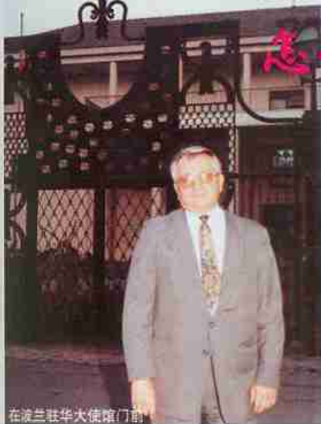
在波兰驻华大使馆门前