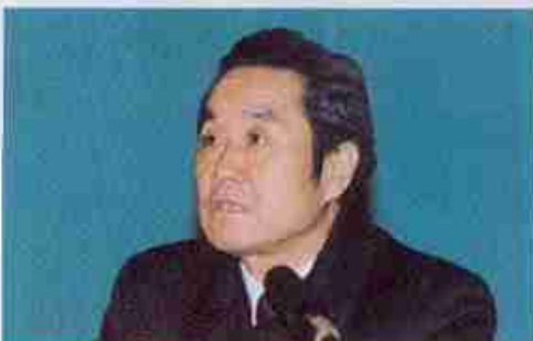
国际贸易专业博士生导师 薛荣久教授