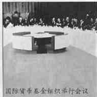
国际货币基金组织平行会议