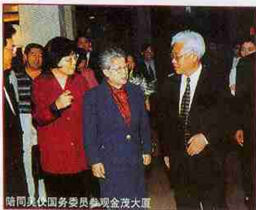
陪同美议国务委员参观金茂大厦

时，他着手组建了好几个大船队，从事海陆空运输，他自学了海运方面的业务知识，读了17本教材。他对运输很有兴趣，三年里为公司赚了不少钱。1993年，他一边担任着中粮总公司的副总裁，一边做金融。1999年1月，他到上海担任了金茂集团有限公司总裁，又开始做房地产了。