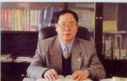
国际贸易专业博士生导师 贾怀勤教授