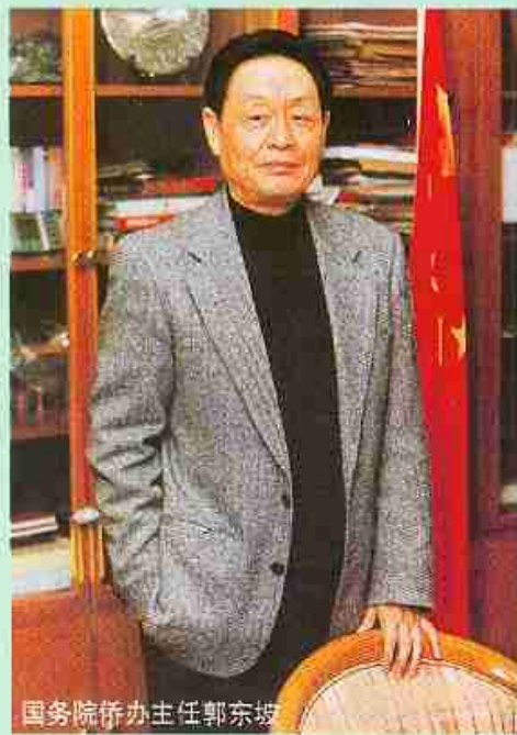
国务院侨办主任郭东坡