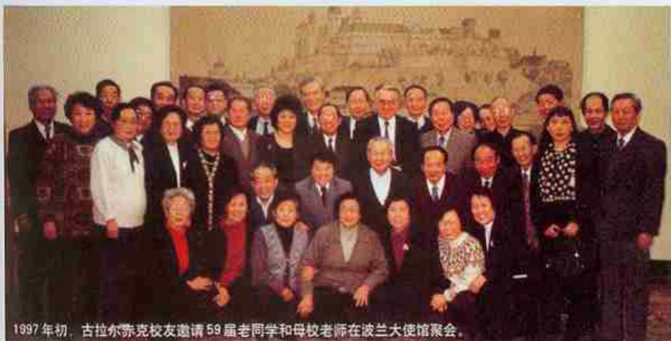
1997年初，古拉尔赤克校友邀请59届老同学和母校老师在波兰大使馆聚会。

波兰共和国驻中华人民共和国特命全权大使。经过多年充分准备，他终于回归到自己在世界大舞台中的最佳位置——从事促进对华关系事务。