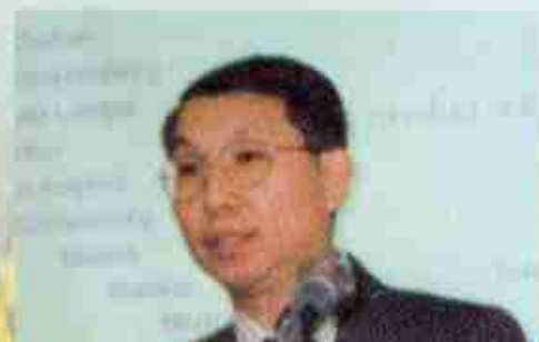
国际贸易专业博士生导师 陈欣教授