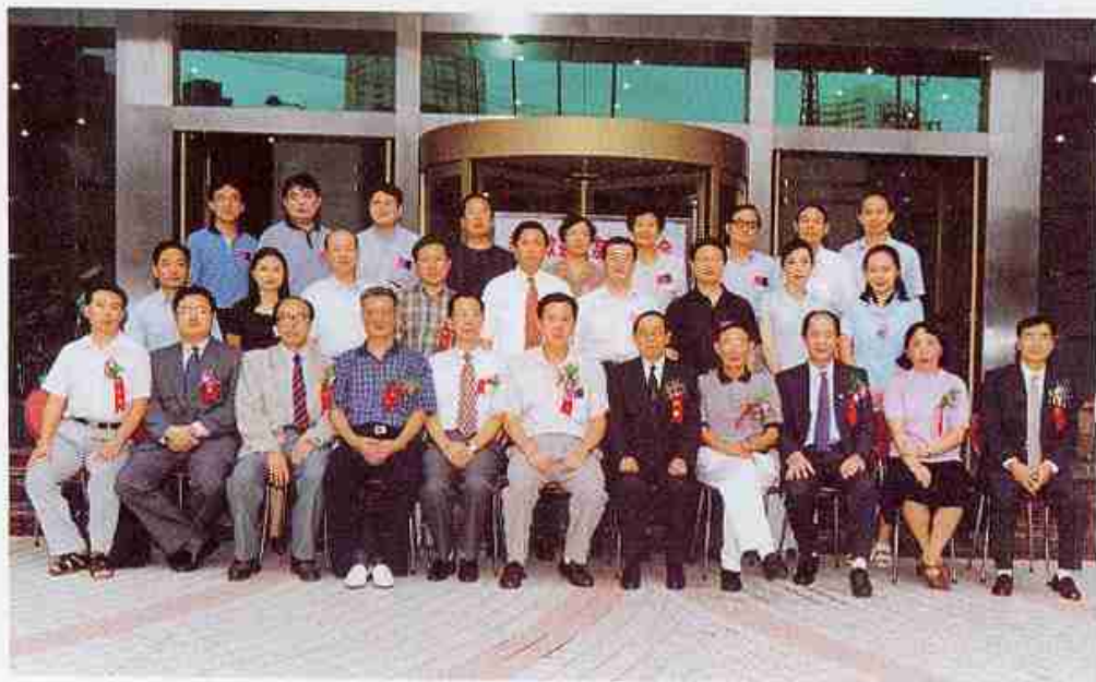
江苏省校友分会第一届理事会成员与校领导合影