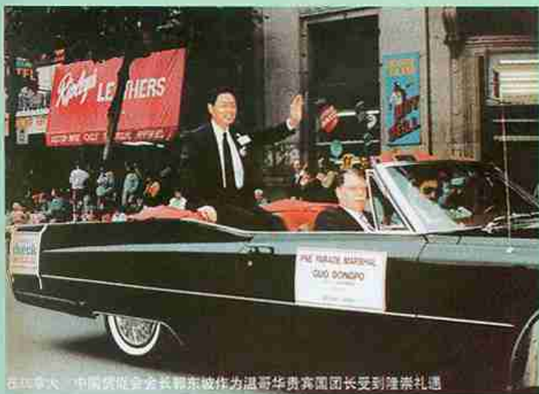
在江泽民、中国贸促会会长郭东波作为温哥华贵宾团团长受到隆重礼遇

个工厂——精美印刷厂当党支部书记。虽然他不懂印刷，但过去做政治工作、组织工作的经历帮了他。作为“班长”，他把大家凝聚在一起，为一个共同的目标而努力。在他领导下，印刷厂成为当时北京市印刷系统的明星企业，在全国同行中也颇有名气。