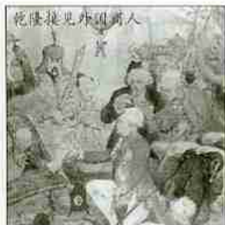
乾隆接见外国商人